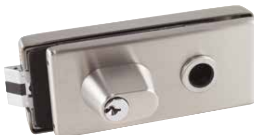
PF251 ENTRÉE (CYLINDRE KIK)